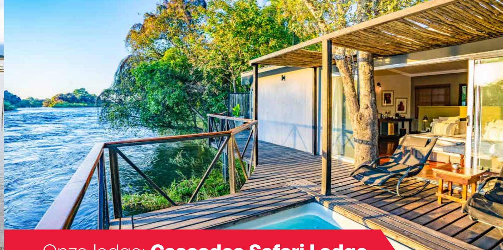
Onze lodge: Cascades Safari Lodge