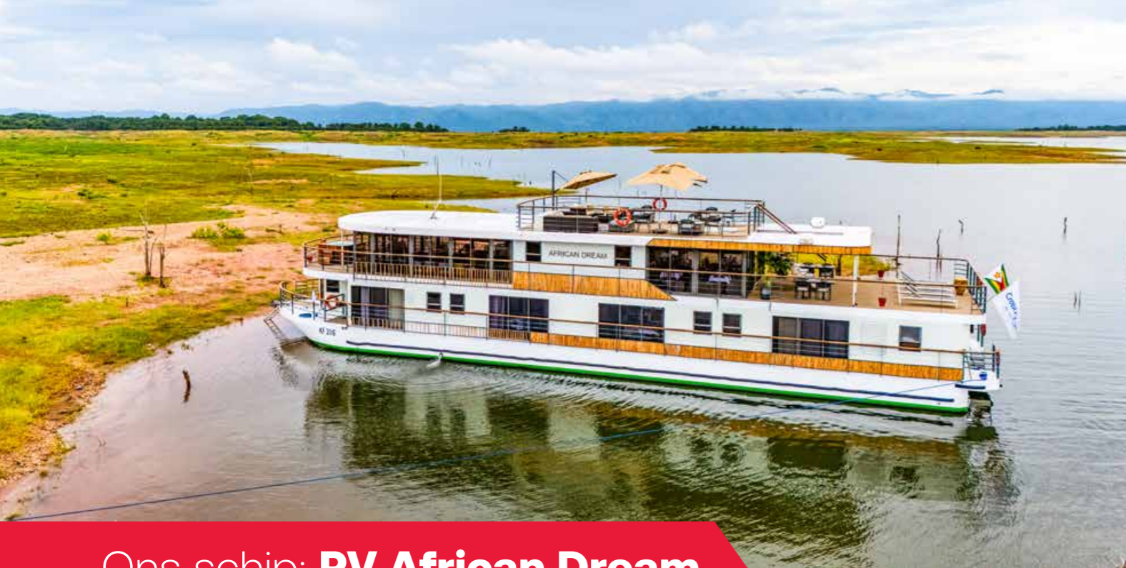
Ons schip: RV African Dream