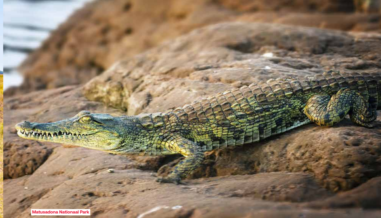
Matusadona Nationaal Park

op het meer. Transfer naar het schip, inscheping en installatie aan boord. Vanaf hier begint onze cruise op het meer, 200 km lang en 40 km breed. Het Karibameer is vooral bijzonder door zijn enorme schaal, de combinatie van techniek en natuur, zijn unieke wildlife-ervaringen vanaf het water maar ook door het surrealistische landschap en de diepe historische en menselijke impact. Diner en overnachting aan boord.