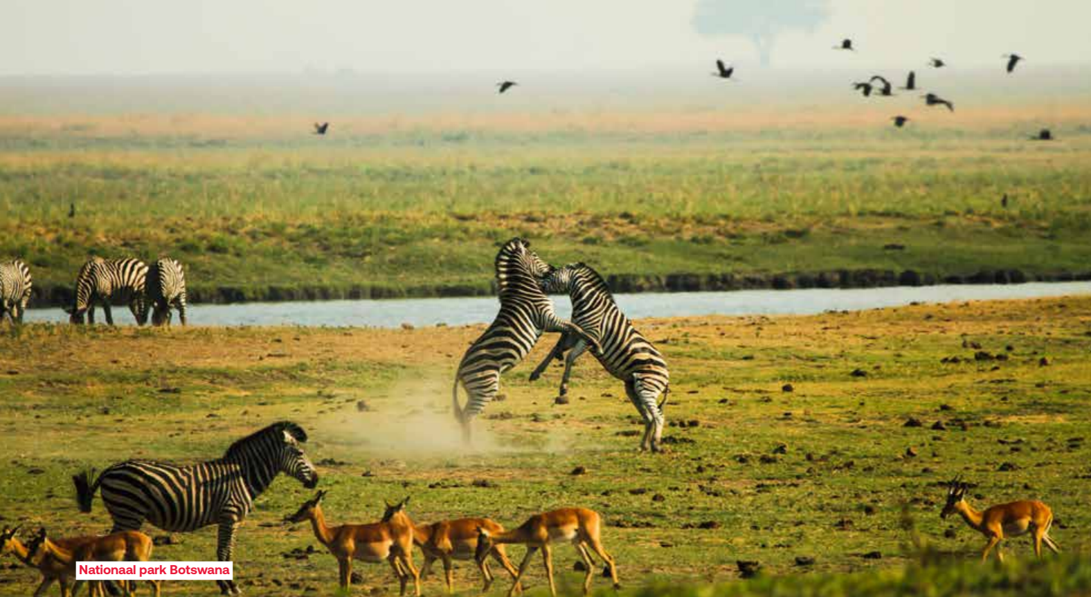
Nationaal park Botswana