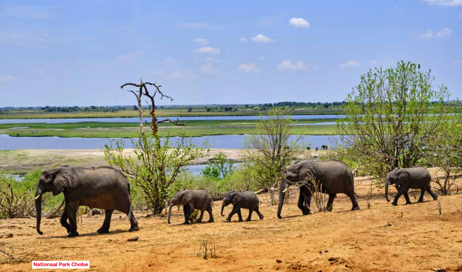
Nationaal Park Chobe

privéboottocht in een van de schilderachtigste zones van het Karibameer, waar olifanten rustig langs de oever wandelen. Diner en overnachting aan boord.