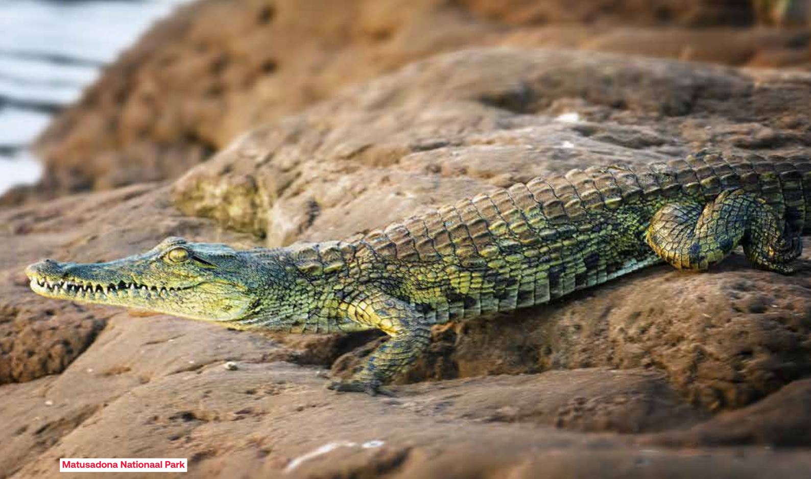
Matusadona Nationaal Park