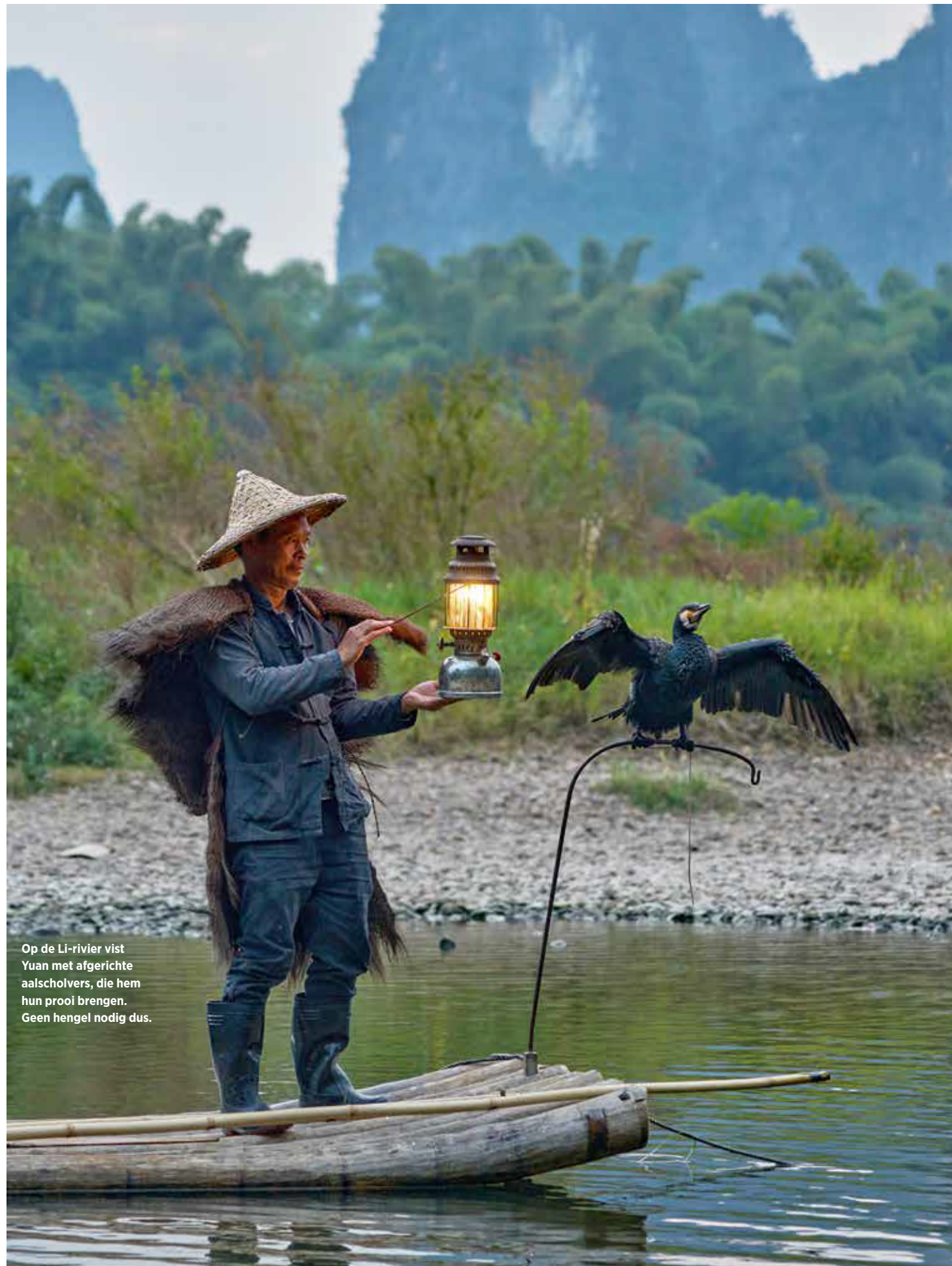
Op de Li-rivier vist Yuan met afgerichte aalscholvers, die hem hun prooi brengen. Geen hengel nodig dus.

we Guilin-stad bezoeken. Hoofden draaien en smartphones klikken. Het is een drukte van jewelste in de shoppingstraten met vele noedelbars en bij de oude stadspoort staan kraampjes waar je souvenirs kunt kopen, zoals gepersonaliseerde waaiers. Wij schepen in op de nachtelijke stadscruise met lichtshow. We vertrekken bij de prachtig verlichte pagodes van de zon en de maan, in goud en zilver, en varen dan onder bruggen door en over de vier vijvers. Onderweg passeren we live taferelen uit alle regio's van China, elegante danseressen en muzikanten inclusief. Een geanimeerd staaltje van fraaie China Lights .