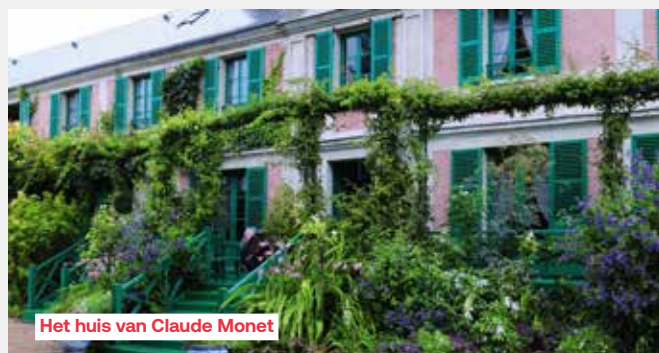
Het huis van Claude Monet

Stap het verleden binnen met een korte rit naar de witte stenen overblijfselen van het bolwerk van de Engelse koning: Château Gaillard. Het werd gebouwd aan het einde van de 12e eeuw op een kalkstenen landtong, met uitzicht op de Seine. U wordt beloond met een prachtig uitzicht op de rivier en het omliggende landschap. Ga verder naar Giverny, waar de kleurrijke flora en de zachte atmosfeer een bron van inspiratie vormden voor een van de belangrijkste