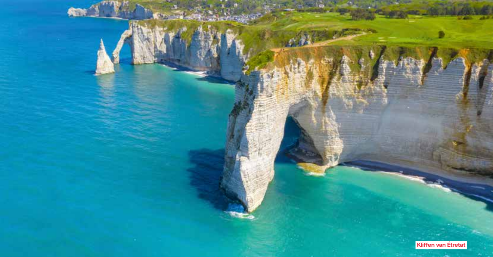
Kliffen van Étretat