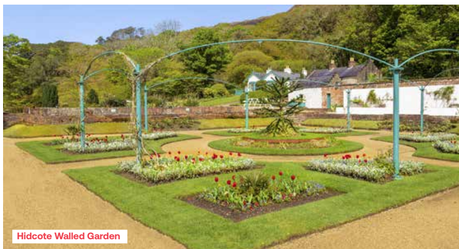
Hidcote Walled Garden

Wisley is met meer dan 1,2 miljoen bezoekers per jaar een drukbezochte tuin, maar met een oppervlakte van maar liefst 97 ha