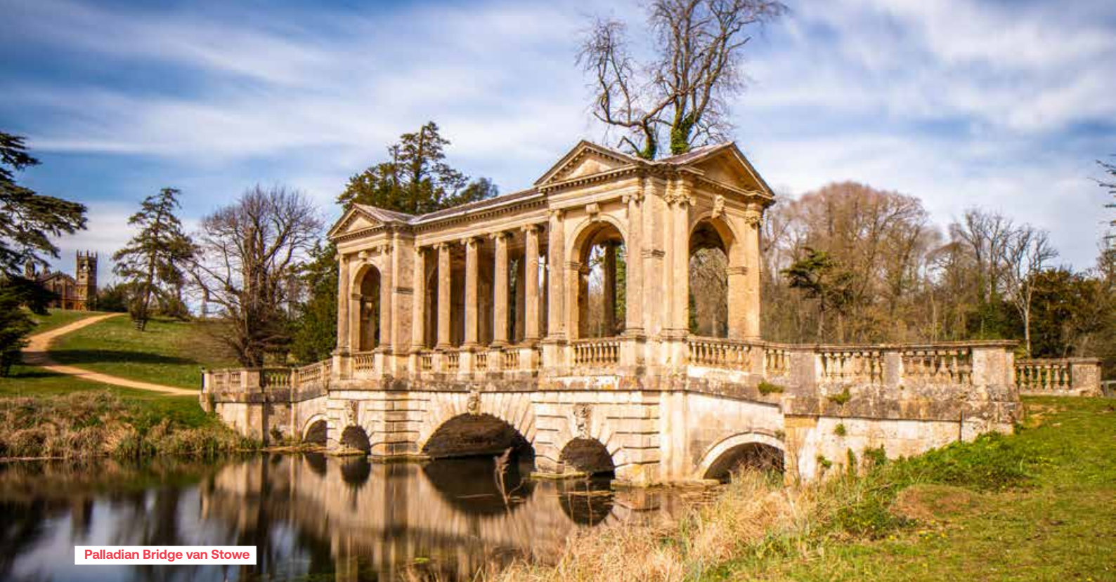
Palladian Bridge van Stowe

Worthies, de Grotto, het Chinese House, de Palladian Bridge en de Gothic Temple. Opgeklommen onder Kent duikt op Stowe een andere grootheid op: Lancelot 'Capability' Brown. Hij werkte verder aan de tuin en ontwierp de Grecian Valley, met grootse tempels op de hogere punten en gaf Octagon Lake en Eleven Acre Lakes een meer natuurlijke uitstraling. Na Kent bepaalde Brown in belangrijke mate het beeld van de Engelse landschapstuin. Daarvan zien we op dag 4 een uitstekend voorbeeld. De laatste grote landschapsarchitect is echter Humphrey Repton die een stempel drukte op de tuin van Sezincote House & Gardens. Met Repton evolueerde de landschapstuin naar het natuurlijke, het pittoreske, het wildere. In de loop van de 18de eeuw slopen 'exotische' elementen in de Engelse landschapstuin. Sezincote House werd in 1805 gebouwd in een Mogolstijl, met een prachtige gebogen orangerie. Dicht bij het huis zien we een meer formele tuin (dit kon weer dankzij Repton); verderop is het genieten van een prachtige uitgebreide watertuin met beken, poelen en watervalletjes in een Indiaas thema