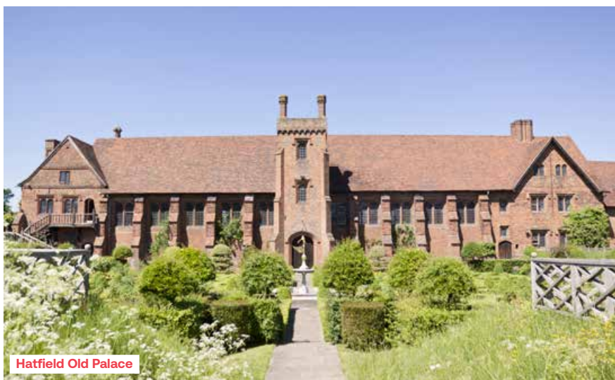
Hatfield Old Palace

In het begin van de 18de eeuw kwam men tot het besef dat de formele baroktuinen zich alsmaar meer vervreemden van de natuur. Met William Kent, geïnspireerd door schilderijen met geïdealiseerde vergezichten van het Romeinse platteland, evolueerde de Engelse tuin naar landschappen waar tuin en parkland samenvloeien, met kunstmatige heuvels en kronkelende padjes en bezaaid met klassieke tempels, beeldhouwwerken en bruggen. Stowe Gardens, initieel het werk van Bridgeman en Kent, is daar een schitterend voorbeeld van met de Elysijsche velden en de Temple of Ancient Virtue, de Temple of British