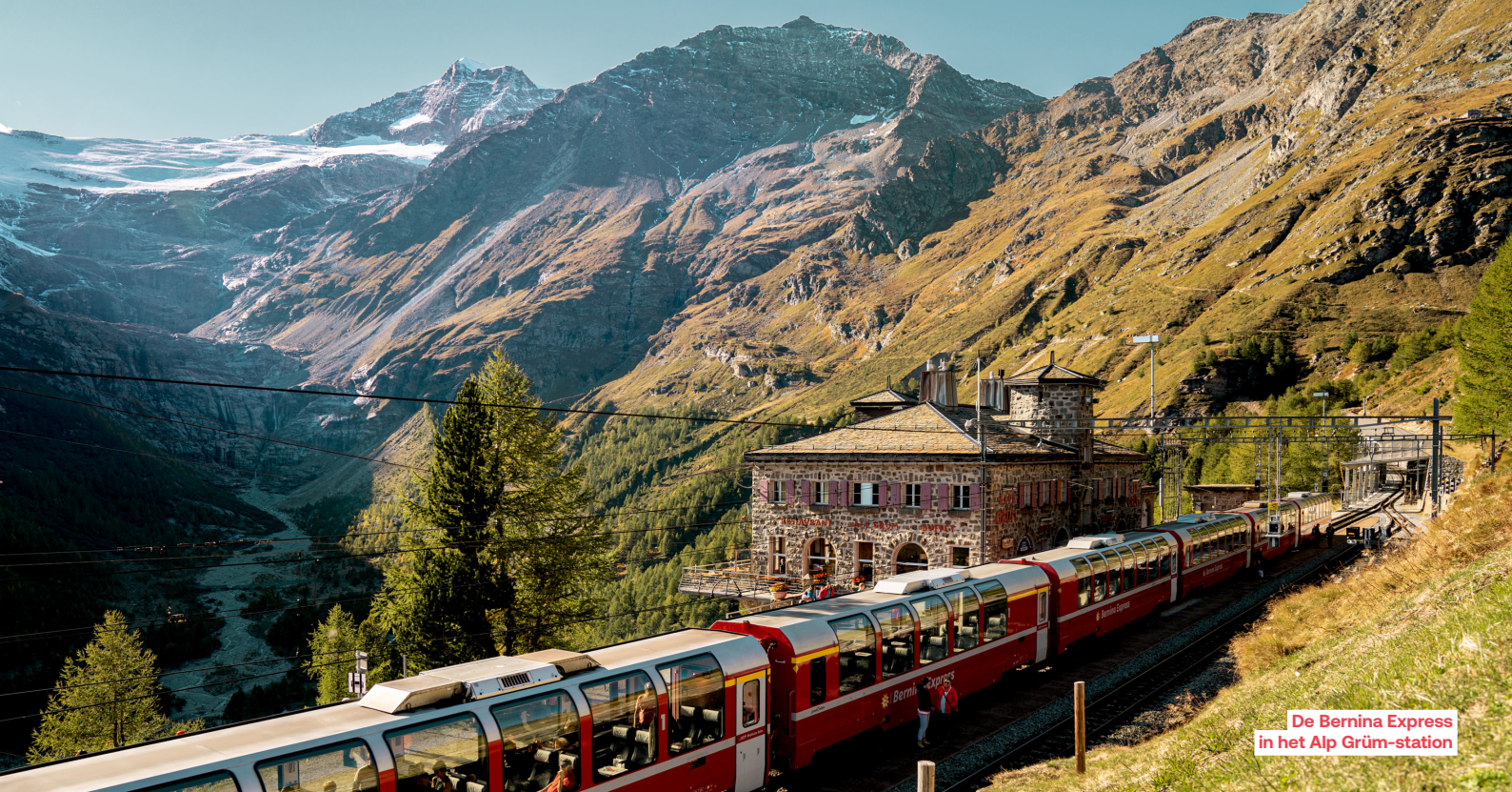
De Bernina Express in het Alp Grüm-station