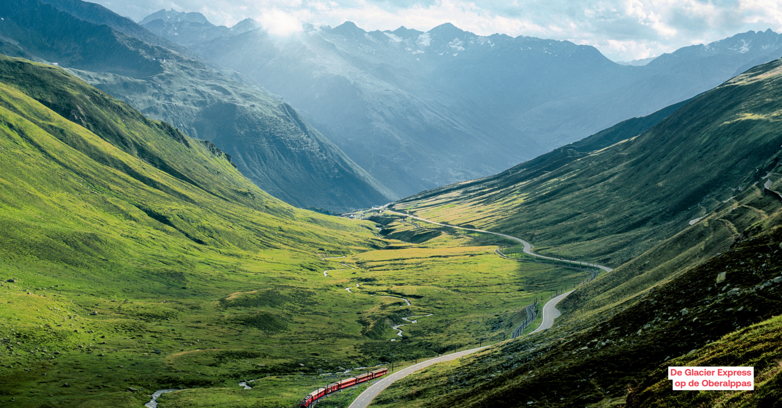
De Glacier Express op de Oberalppas