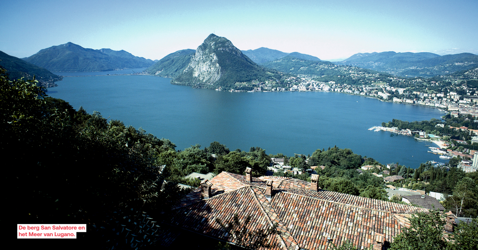
De berg San Salvatore en het Meer van Lugano.

De rest van de dag bent u vrij. Vrije lunch. U kunt een bezoek brengen aan het Alpenmuseum waar u alles te weten komt over de geschiedenis van dit bergbeklimmersdorp. Ook kunt u ervoor kiezen om een tocht per tandradbaan naar de 3090 m hoge Gornergrat te maken (weersafhankelijk). U wordt dan beloond met een fantastisch uitzicht op de Monte Rosaketen en de overige bergen rondom Zermatt. Diner, overnachting en ontbijt.