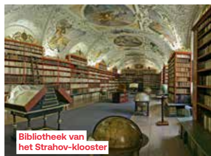
Bibliotheek van het Strahov-klooster

Moldau. Praag is in december een kleurrijke plek met een magische en feestelijke sfeer. We ontdekken de charme van de Gouden Stad vanaf het water en bewonderen 's avonds de verlichte monumenten.