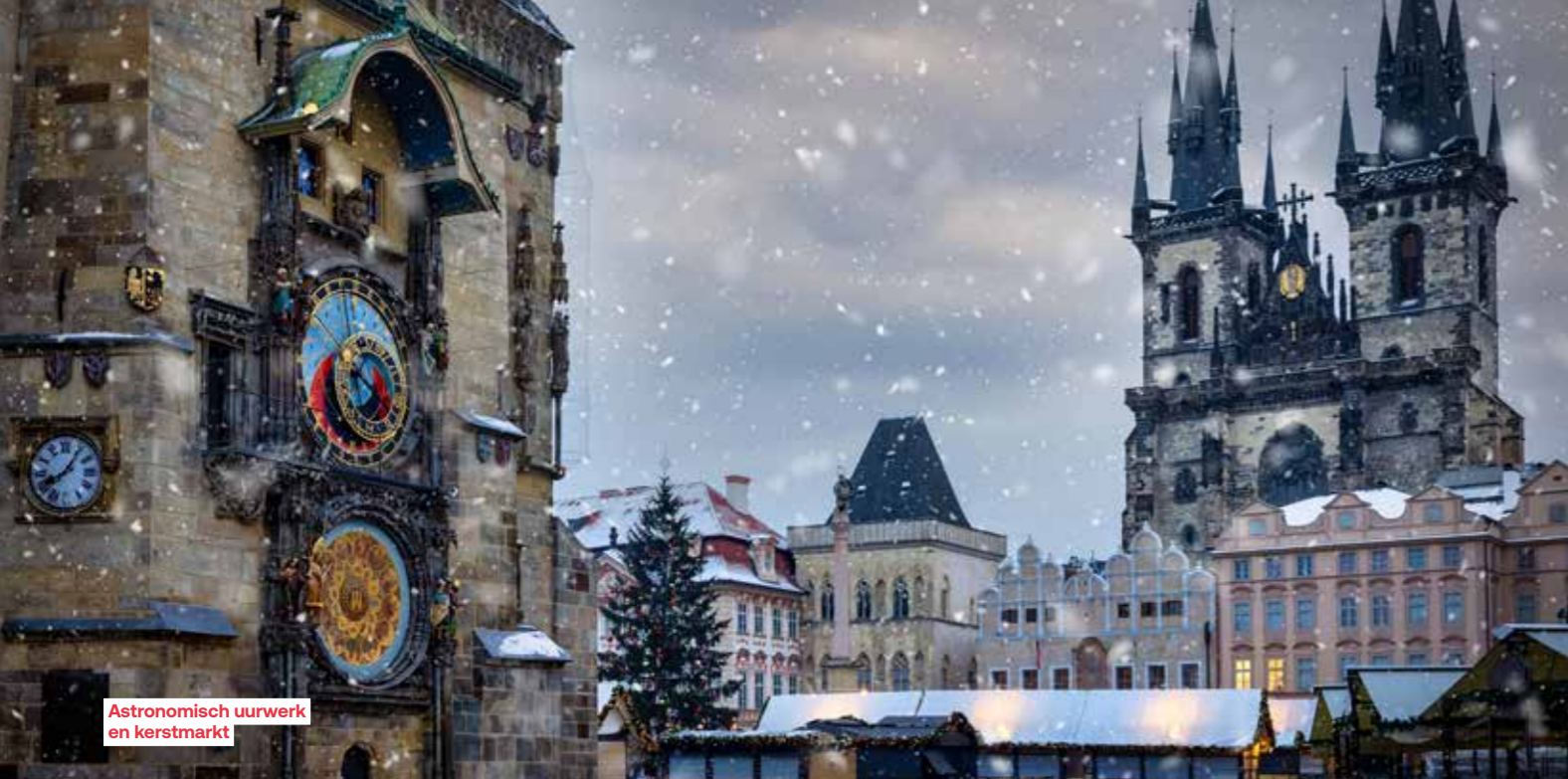
Astronomisch uurwerk en kerstmarkt