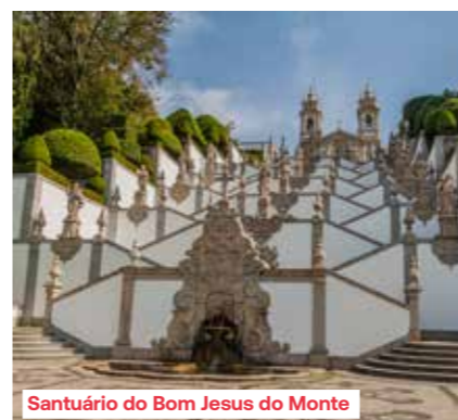
Santuário do Bom Jesus do Monte

In de voormiddag vertrekt u met de autocar naar Braga. De stad, die haar bijnaam 'Rome van Portugal' dankt aan haar grote aantal kerken, heeft een rijk architecturaal en historisch verleden. Ook vandaag is Braga nog altijd een van de belangrijkste religieuze centra van het land. Net buiten de stad ligt het Santuário do Bom Jesus do Monte. De grote trap die naar de top leidt,