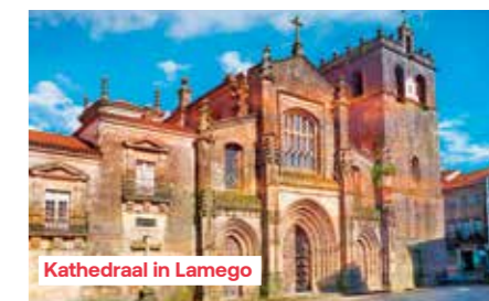
Kathedraal in Lamego

kathedraal uit de 12e eeuw, die in de loop der eeuwen vele malen werd verbouwd en daardoor vandaag een bijzonder eclectisch geheel van stijlen laat zien. Daarna staat een bezoek aan het museum van Lamego op het programma. In het voormalige bisschoppelijk paleis uit de 18e eeuw ontdekt u een collectie beeldhouwwerken, schilderijen en wandtapijten van onschatbare waarde. Folkloristische voorstelling aan boord.