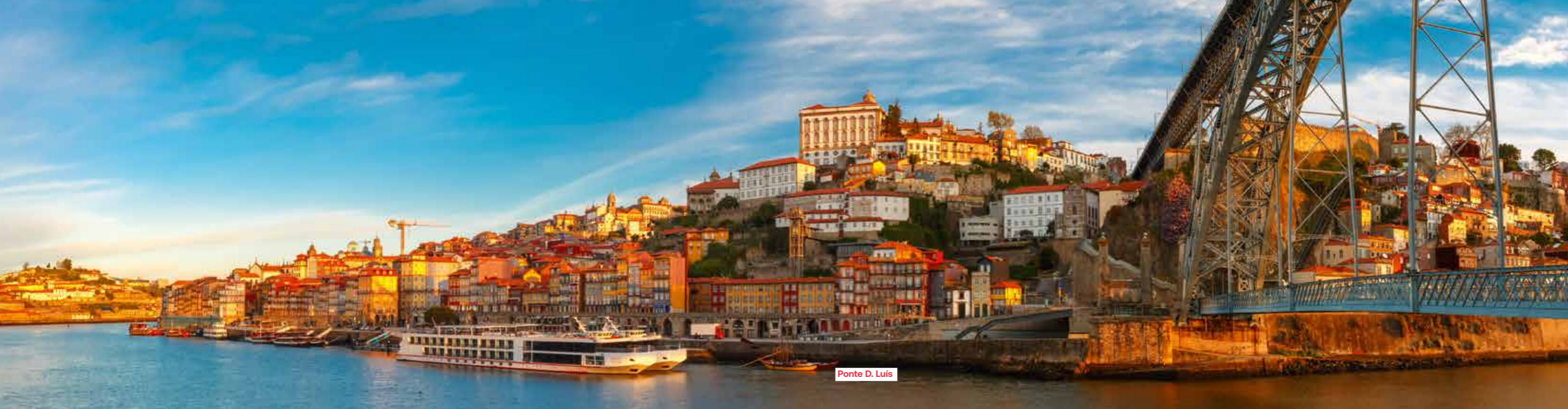
Ponte D. Luís