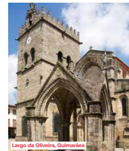
Largo da Oliveira, Guimarães

onafhankelijkheid van het land en fungeerde als eerste hoofdstad. Ontdek het voorbeeldig gerenoveerde middeleeuwse stadscentrum met een bijzondere architecturale homogeniteit. Een wirwar van straatjes verbindt de pleinen met elkaar, waaromheen oude huizen van graniet staan. Het plein Largo da Oliveira, of Olijfboomplein, is een opmerkelijk goed bewaard middeleeuws complex. Bezoek het paleis van de hertogen van Bragança, waarvan de architectuur doet denken aan de kastelen van Bourgogne. Terugkeer naar het schip in Porto en overnachting aan wal.