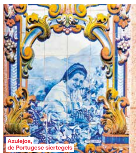
Azulejos, de Portugese siertegels

De volgorde van de bezoeken kan gewijzigd worden naargelang de vluchten, vaarroute of technische specificaties. Door weersomstandigheden kan een aanlegplaats geannuleerd of vervangen worden: dit kan enkel beslist worden door de kapitein die altijd een oplossing zal zoeken zo voordelig mogelijk voor de passagiers.