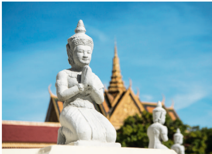
Het Koninklijk Paleis in Phnom Penh kan je gewoon bezoeken.

“Volgeladen brommertjes rijden kriskras tussen de vele kraampjes en marktbezoekers”