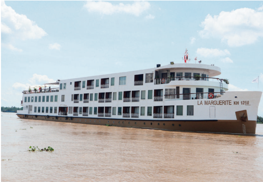
Reizen in stijl: de Marguerite ziet eruit als een oud koloniaal schip.