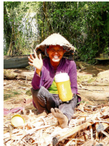
Overal waar we komen, wuiven de inwoners ons enthousiast toe. Ook op het landbouweiland bij Tan Chau.

bezoeken we een eilandje bewoond door boeren. Velden vol mangobomen en peperstruiken, kippen die rondscharrelen tussen de paalwoningen, een visser die zijn netten maakt... Boeiend om te zien hoe de inwoners leven. Overal waar we komen, worden we enthousiast onthaald. De bewoners lachen en zwaaien, en poseren met plezier voor onze foto's. Daarna zetten we koers naar de meer industriële kant van Tan Chau, waar we een fabriekje bezoeken waar matten uit bamboe en hennep gemaakt worden. We ruilen er onze bootjes in voor fietsriksja's, die ons naar een zijdefabriek brengen. Boeiend om te zien hoe een zijdecocon van enkele centimeters groot verwerkt kan worden tot de meest prachtige kimono's en andere zijden hebbelingen. Na ons bezoek aan Tan Chau zet de Marguerite koers naar Sa Dec, dat we de volgende dag bezoeken. Ons schip in koloniale stijl vaart immers enkel overdag, ideaal om op het dek te genieten van de omgeving. In Sa Dec komt Marguerite Duras opnieuw op de proppen. De Franse schrijfster bracht hier een deel van haar kindertijd door, en hier