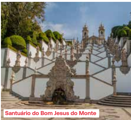
Santuário do Bom Jesus do Monte

dankt aan haar grote aantal kerken, heeft een rijk architecturaal en historisch verleden. Ook vandaag is Braga nog altijd een van de belangrijkste religieuze centra van het land.