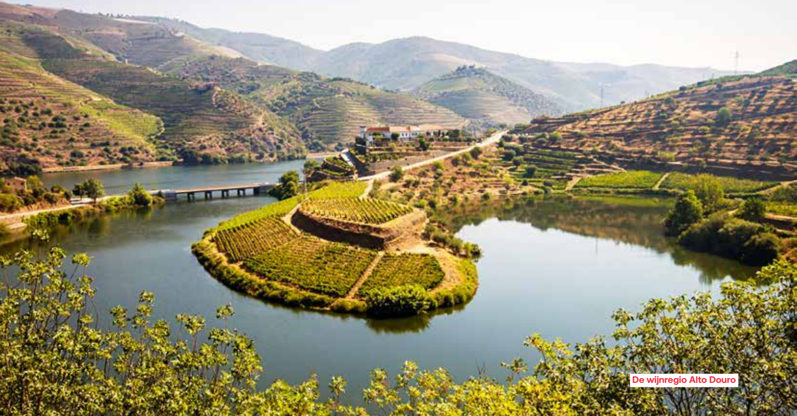
De wijnregio Alto Douro