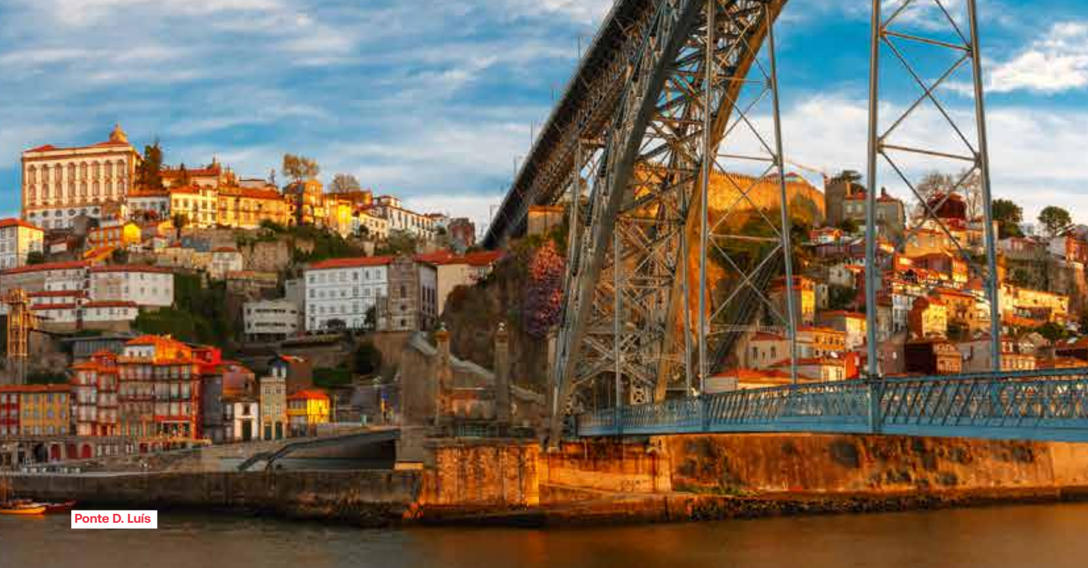
Ponte D. Luís