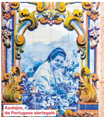
Azulejos, de Portugese siertegels

In de voormiddag vaart de M/S Queen Isabel naar Vila Nova de Gaia in Porto. Lunch is voorzien aan boord. In de namiddag vertrekt u met de bus naar Porto voor een stadsbezoek. Het fraai gerestaureerde historische centrum prijkt sinds 1996 op de lijst van Unesco-werelderfgoed. De op een na grootste stad van Portugal is een lust voor het oog: met een doolhof van straatjes, kleurrijke vissershuisjes, azulejos, bloemrijke balkons en winkelstraten. De huizen liggen als het ware tegen de steile oevers van de Douro geplakt, die hier zijn lange weg door Spanje en Portugal beëindigt.