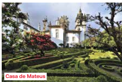
Casa de Mateus

Kort na de middag meren we aan in Régua, de poort tot de wijnregio Alto Douro (Hoge Douro), gevormd door duizenden jaren wijnbouw. Deze stad midden in de vallei was het hart van de wijnhandel in de 13e eeuw. We bezoeken er het moderne museum van de Douro, gelegen in een oud magazijn. Het museum wil het erfgoed van de wijngelieden langs de bovenloop van de Douro, die opgenomen zijn als Unesco-werelderfgoed,