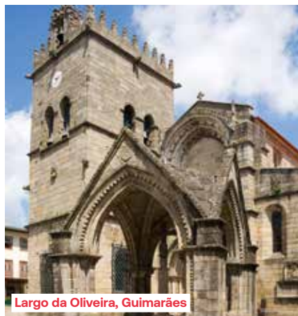
Largo da Oliveira, Guimarães

In de namiddag bezoeken we Guimarães, ten noordwesten van Porto en de geboortestad van de eerste koning van Portugal, Afonso Henriques. De stad speelde een belangrijke rol in de onafhankelijkheid van het land en fungeerde als eerste hoofdstad. Ontdek het voorbeeldig gerenoveerde middeleeuwse stadscentrum met een bijzondere architecturale homogeniteit. Een wirwar van straatjes verbindt de pleinen met elkaar, waaromheen oude huizen van graniet staan. Het plein Largo da Oliveira, of Olijfboomplein, is een opmerkelijk