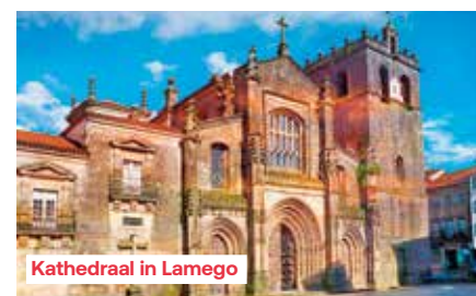
Kathedraal in Lamego