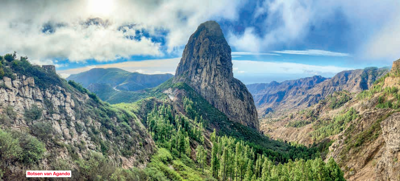
Rotsen van Agando