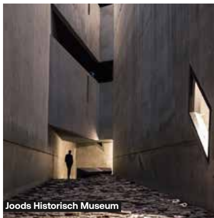
Joods Historisch Museum

In de voormiddag bezoeken we het Joods Historisch Museum, een ontwerp van architect Daniel Libeskind dat is uitgegroeid tot een van de iconen van Berlijn. Het gebouw bestaat uit vijf verdiepingen, echter het exterieur en het interieur hebben niet de aanblik van een museum. De ruimtes hebben veel hoeken en geven steeds weer andere gezichtspunten. Er zijn zowel grote als kleine hallen en gangen, waardoor het geheel een labyrint lijkt te vormen. De inrichting van het gebouw moet de bezoeker dan ook bewustmaken van de vele ontberingen die de geschiedenis van de joden